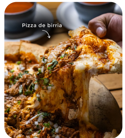
Pizza de birria

BASE DE FRIJOL, FAJITAS DE ARRACHERA(250 G), CEBOLLA, AGUACATE & CHIMICHURRI.