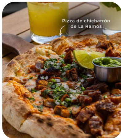
Pizza de chicharrón de La Ramos

CHICHARRON NORTEÑO DE LA FAMOSA CARNICERIA DE MONTERREY "LA RAMOS" (200 G) CON GUACAMOLE (80 G) Y SALSA DE LA CASA.