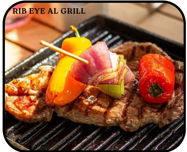
RIB EYE AL GRILL